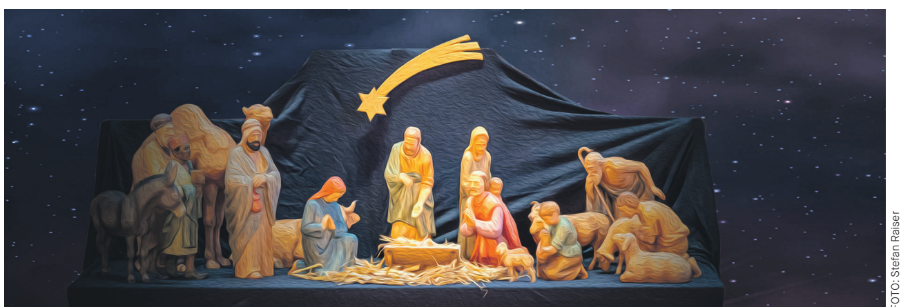
Das Licht von Bethlehem an der Krippe in der Kirche Seeburg.