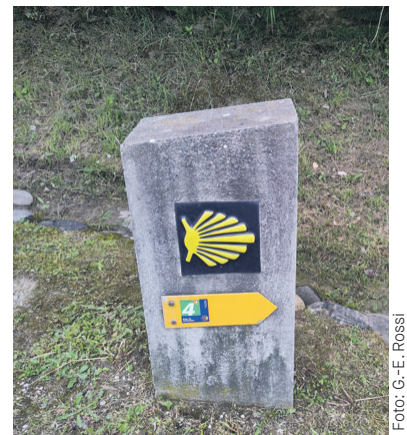
Wegzeichen am Jakobsweg

Sämtliche Unterlagen liegen 30 Tage vor der Versammlung zur Einsichtnahme in der Gemeindeverwaltung Wynigen auf oder können im Internet ( www.kirchwynigen.ch ) eingesehen werden.