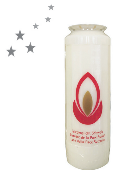
FOTO: Kerze Friedenslicht

Es besteht die Möglichkeit für Fr. 10.- eine Ölkerze mit einer Brenndauer von 9 Tagen zu kaufen.