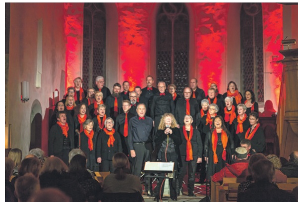
Der Chor in Aktion bei seinem letztjährigen Konzert in der Kirche Seeburg.

Am Samstag, 14. Dezember 2024 um 17.00Uhr Kirche Seeburg, Eintritt frei – Kollekte